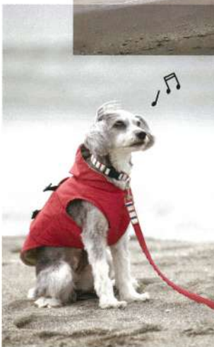
たっぷり遊んでご満悦♪ 水遊び好きのワンちゃんなら、特にご機嫌になることまちがいない。

〒248-0014 神奈川県鎌倉市由比ガ浜海岸 ☎0467-39-6043 (由比ガ浜茶亭組合) ※7月1日から8月31日の遊泳期間中、ペットの散歩は9:00～17:00以外のみ可。